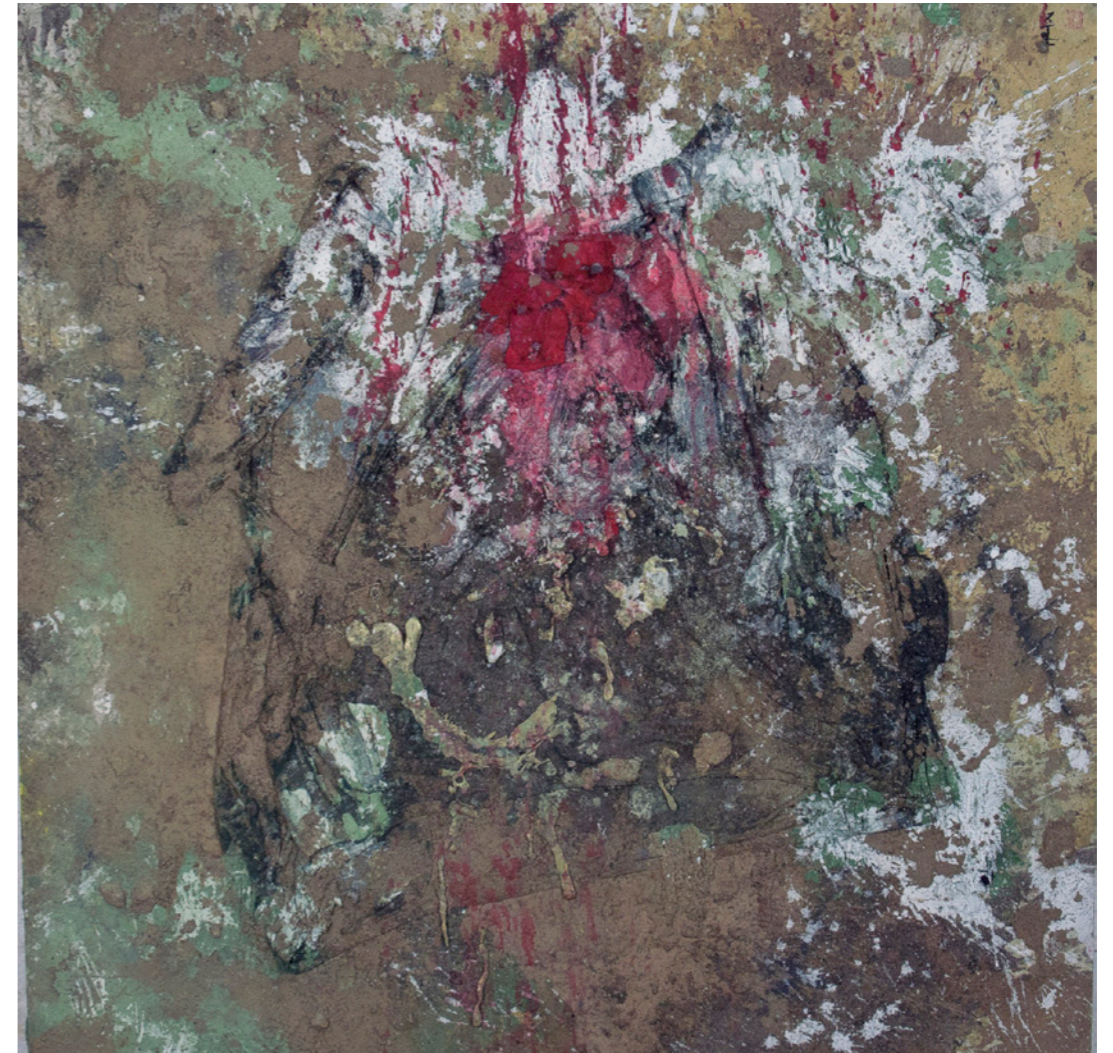
Dolor I, 2026 Técnica mixta 118 x 118 cm