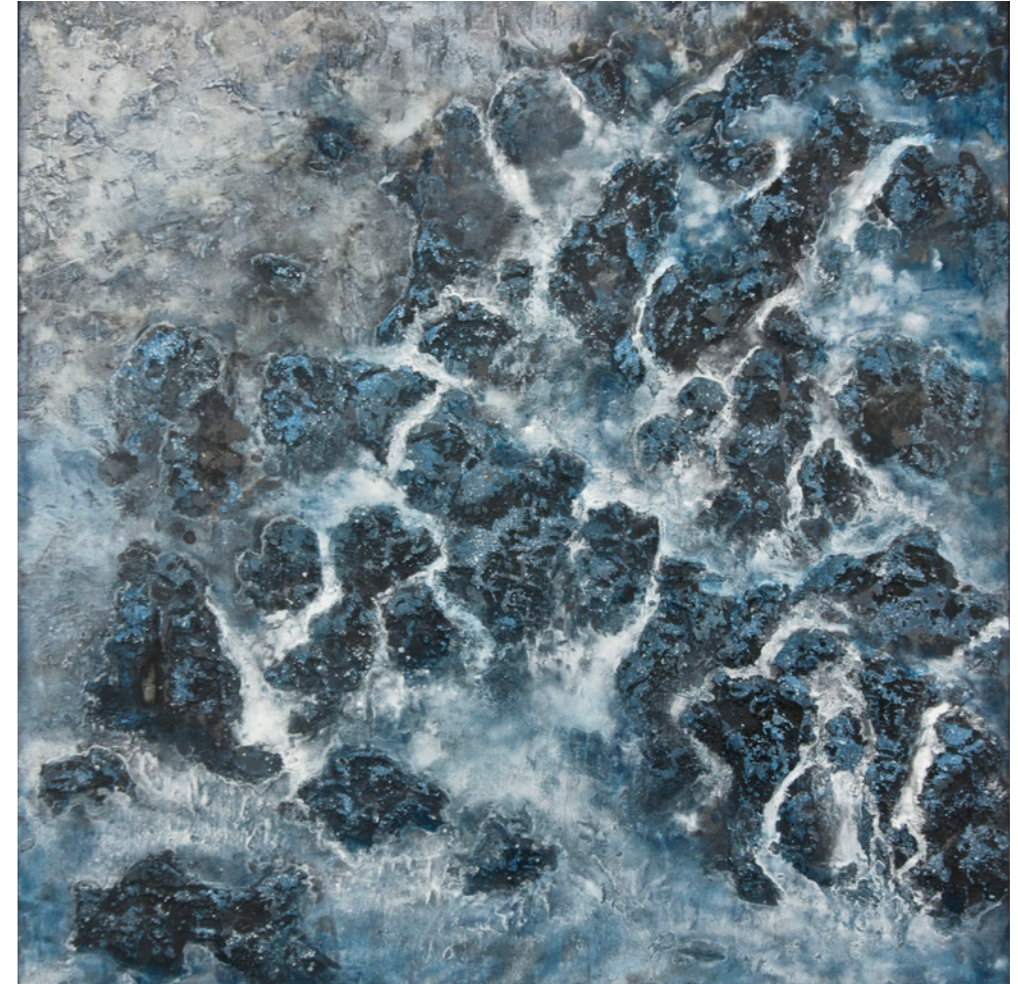
San I, 2024 Técnica mixta 100 x 100 cm