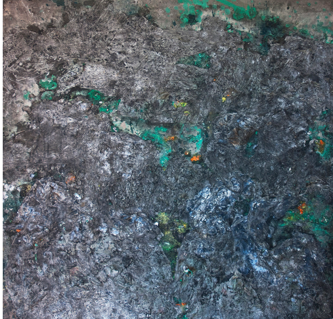
N2, 2025 Papel coreano, tierra y pigmentos 98 x 98 cm