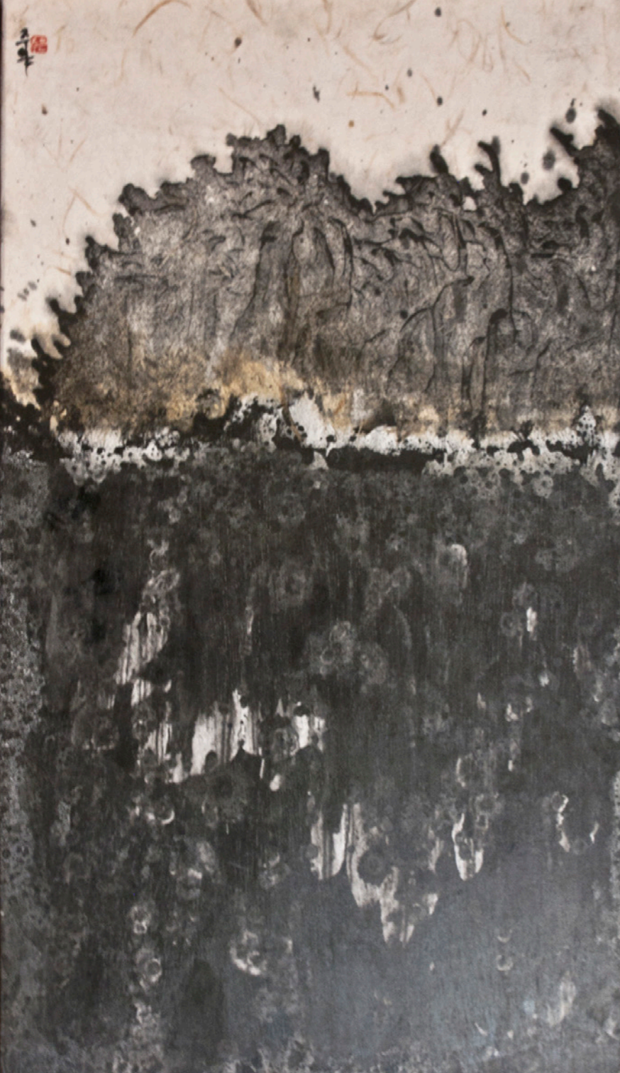
Clif, 2023 Tierra blanca, papel coreano y pigmentos 70 x 40 cm