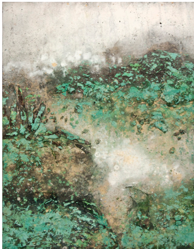
ML&D dyp II, 2021 Técnica mixta 81 x 62 c/u cm