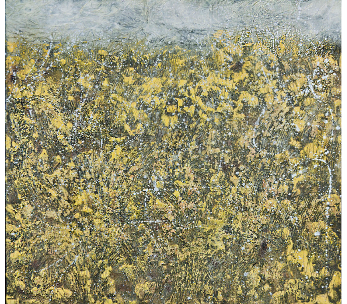
TXN III, 2024 Técnica mixta 60,3 X 55 cm