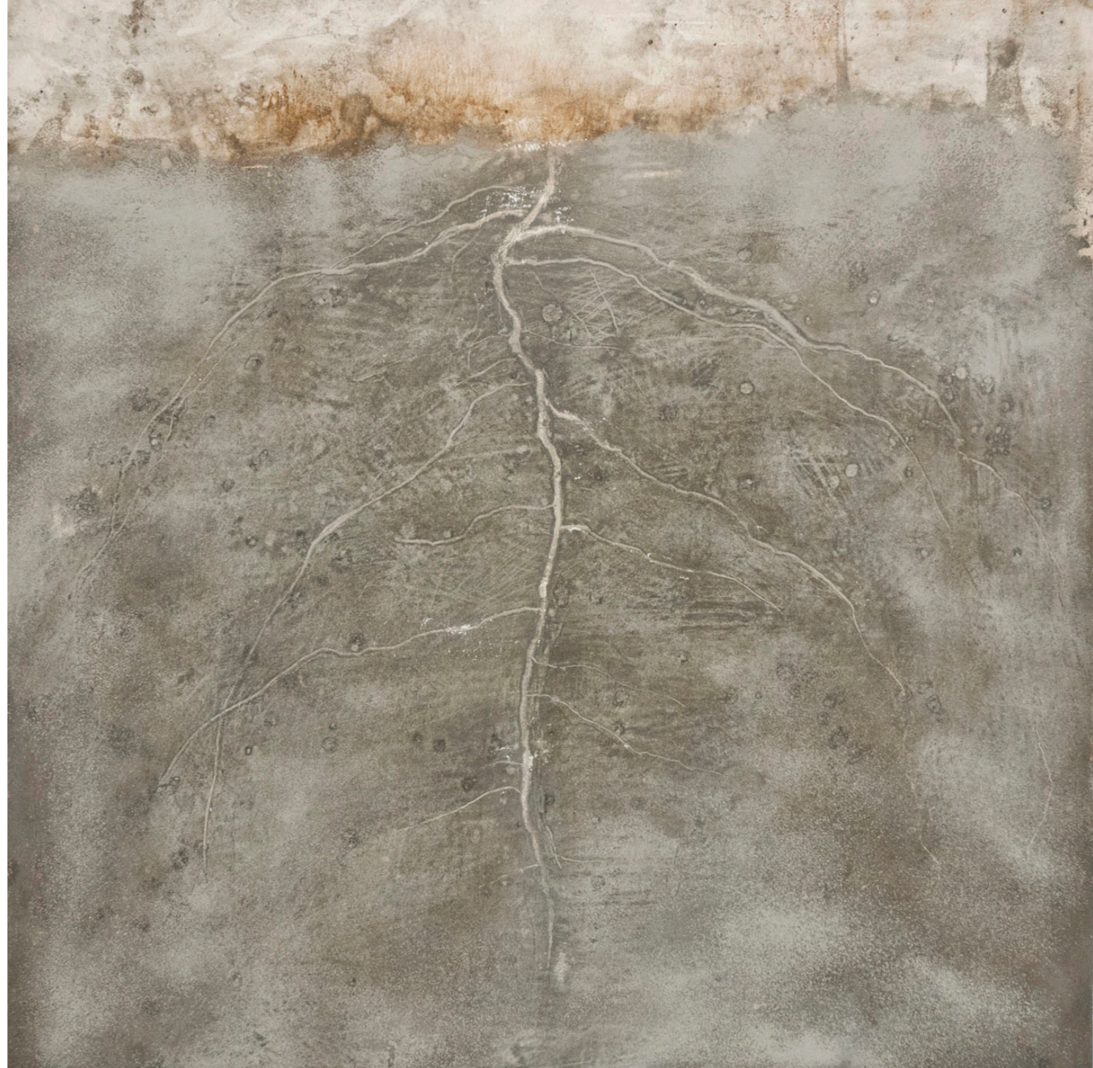
Radix, 2023 Tierra, ceniza y pigmento 98 x 98 cm