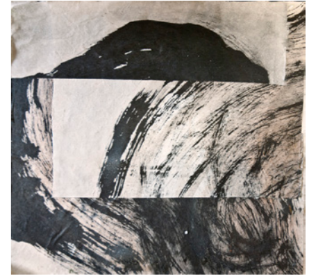
Fig. I, II, III, IV, V y VI, 2026 Papel coreano y tinta 30 x 30 cm