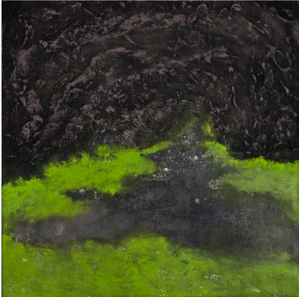
SWS XII, 2024 Técnica mixta 100 x 100 cm