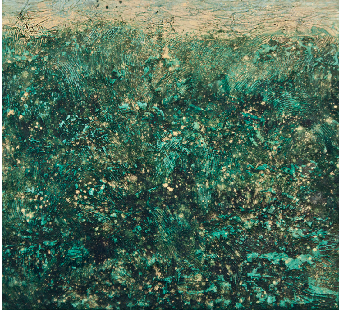
TXN II, 2024 Técnica mixta 60,3 X 55 cm