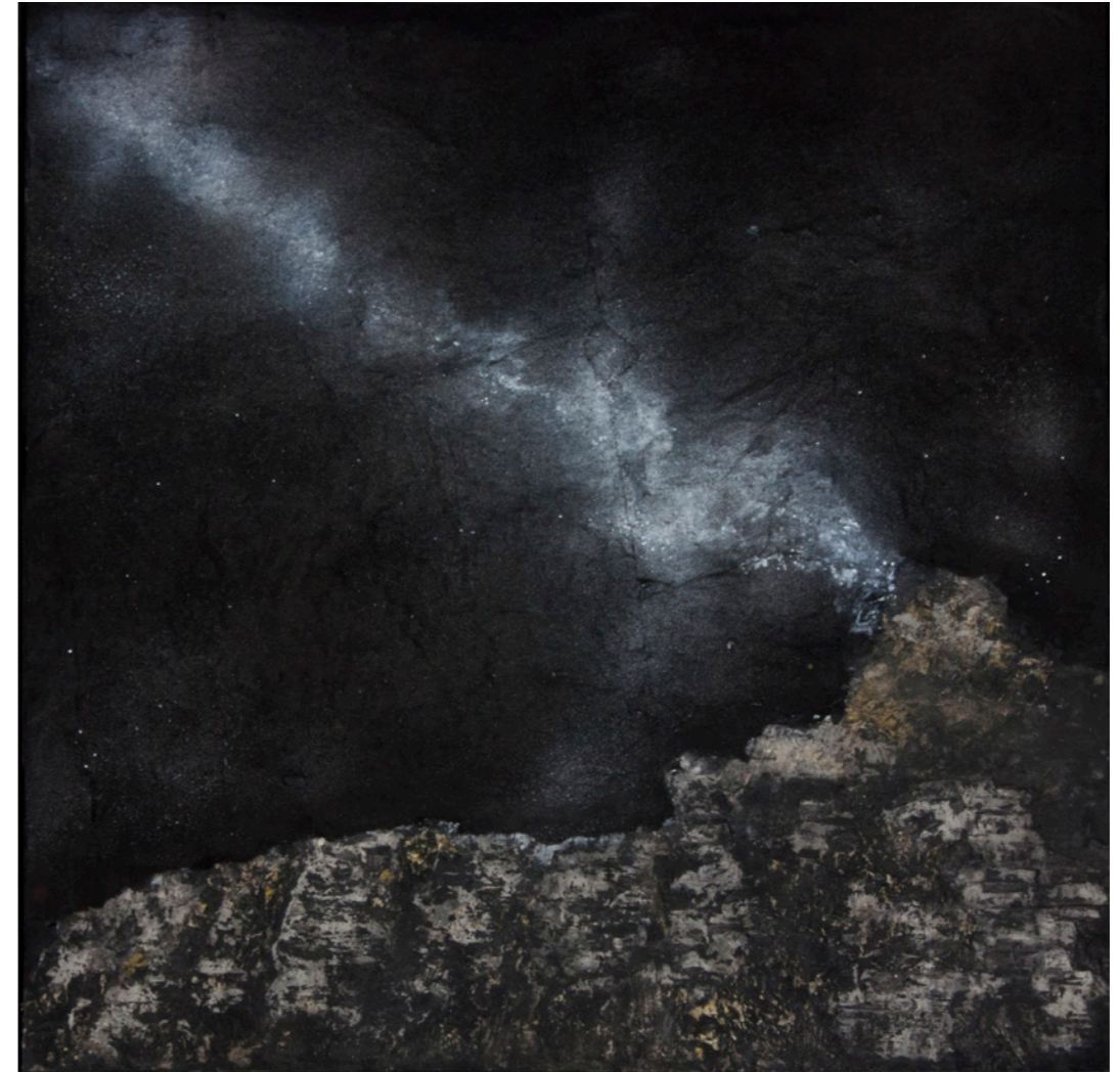
Stary night, 2023 Papel coreano, tierra y pigmento 120 x 120 cm