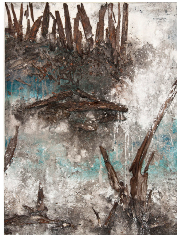
ML&D dyp I, 2021 Técnica mixta 81 x 62 c/u cm